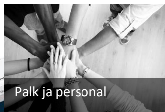
Palk ja personal