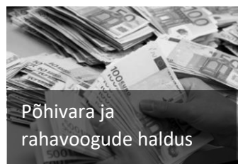
Põhivara ja rahavoogude haldus