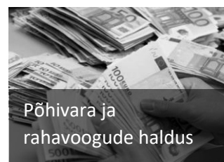
Põhivara ja rahavoogude haldus