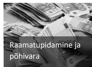
Raamatupidamine ja põhivara