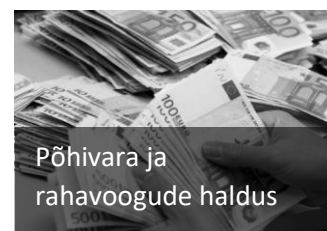
Põhivara ja rahavoogude haldus