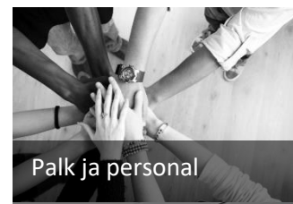
Palk ja personal