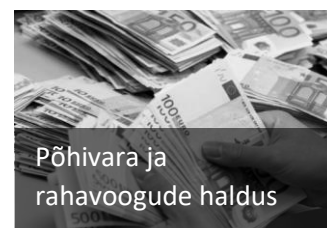
Põhivara ja rahavoogude haldus