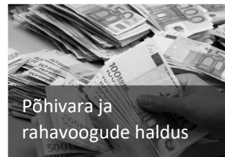
Põhivara ja rahavoogude haldus