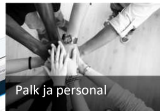
Palk ja personal