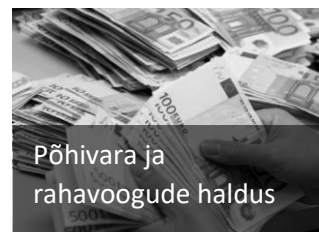
Põhivara ja rahavoogude haldus