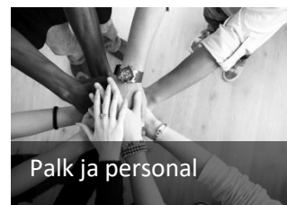
Palk ja personal